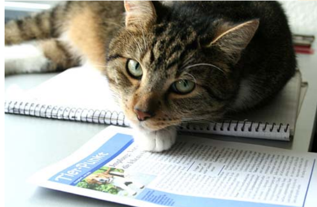
Kater Elvis ist noch häuslicher geworden.

Da ich bei einem größeren Ausflug von unserem unliebsamen Nachbarskater „vermöbelt“ worden bin und mich der Tierarzt erst einmal krank schreiben musste, war ich in meinem geliebten Garten einige Zeit nicht einsatzfähig.