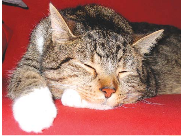
Kater Elvis ist geschafft vom WM-Stress.

In meinem Haushalt regiert das Chaos! Herrchen vergisst neuerdings ständig, das Katzenklo sauber zu machen. Subtile Signale meinerseits verfehlen völlig ihre Wirkung. Da hilft nur lauthals miauen und vor der Toilette einen Sitzstreik abhalten.