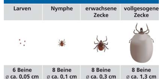
Abbildung 2